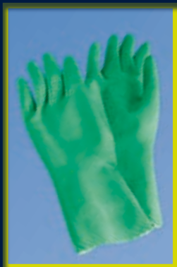
Guanti speciali in gomma di SIGVARIS

SIGVARIS consiglia i seguenti articoli aggiuntivi: