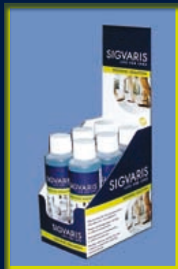
Washing Solution di SIGVARIS

SIGVARIS è leader mondiale nel mercato delle calze terapeutiche ed è distribuita in oltre 70 paesi.